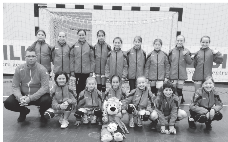
A Nyáradszereda Sportklub ifi 5-ös lánykézilabda-csapata.