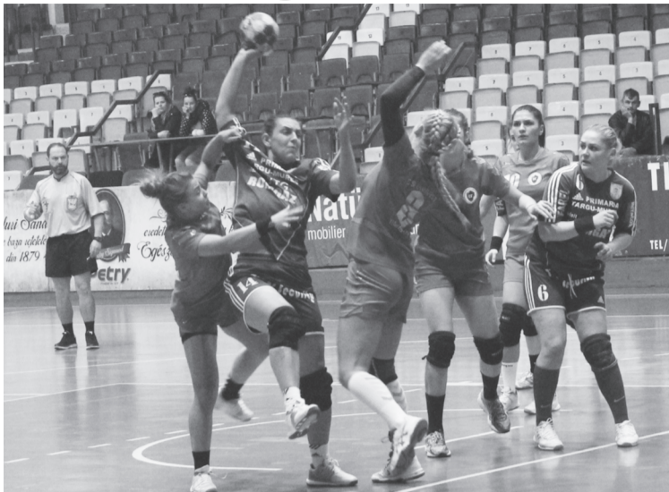
Már az első félidőben lett volna lehetőség nagyobb előny kiépítésére, de támadásban több hibát követtek el a marosvásárhelyi játékosok.

A női kézilabda A osztályban húsvét után egy héttel folytatódik a küzdelem, de a Mureşul szabadnapos lesz, így legközelebb április 26-án, szerdán a Nagybányai Extrem otthonában lép pályára.