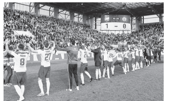
A DAC játékosai ünnepelnek, miután a szlovák labdarúgó-bajnokságban játszott mérkőzésen 1-0-ra nyertek a Slovan csapata ellen a dunaszerdahelyi DAC Arénában 2017. április 8-án.